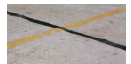
Vent 20 min.