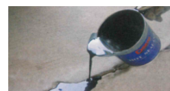
Fyll i sprekken