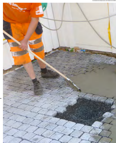
Enkel fuging. Bland og hell ut. Hjelp til med svaber. Vent - deretter spylers du belegget rent.

NB! VIKTIG: Les den detaljerte bruksveiledning for produktene på faktabladene og evt. www.betomur.no før du starter arbeidet!