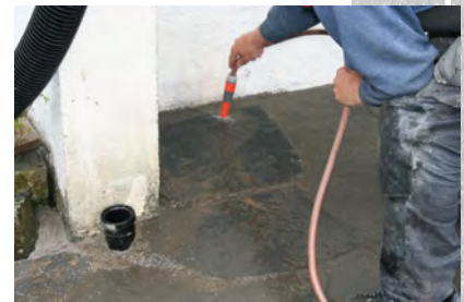
Enkel fuging. Bland og hell ut. Hjelp til med svaber. Vent - deretter spyles du belegget rent.