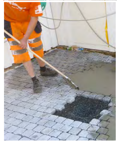
Enkel fuging. Bland og hell ut. Hjelp til med svaber. Vent - deretter spyles du belegget rent.

PS: Om ønskelig så leverer vi også permeable fugemasser