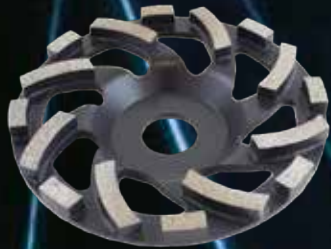
Diamantslipekopp Turbo Ø125mm Bosun. Bestselger!