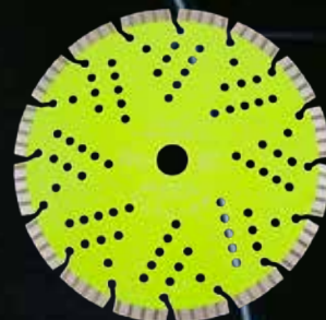
Diamantblad Ø230 Turboseg. Grønn Bosun.

Ypperste kvalitet til kapping av stein, kan og brukes til betong MM.