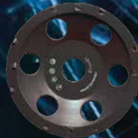
Diamantslipekopp PCD Ø125mm Bosun.

Veldig effektiv til sliping av maling, epoxy og andre tynne belegg.