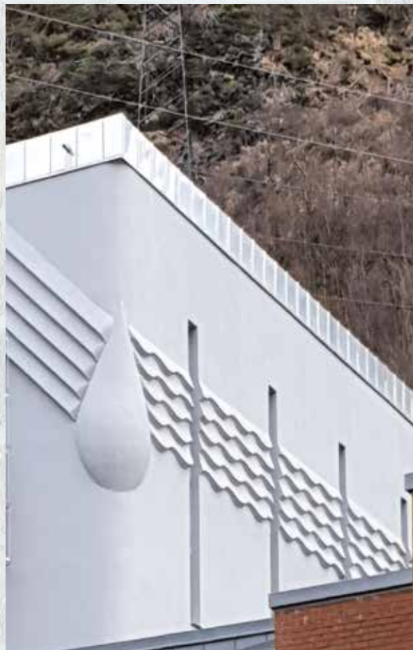
Bildet viser Svartediket vannverk, arbeid utført av Bergen Kommune.