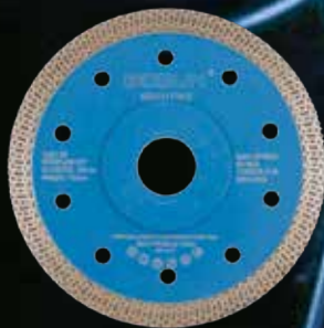
Diamantblad mesh Ø125 Pro Blå Bosun.

En favoritt for de fleste for kutting av flis.