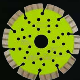
Diamantblad Ø125 Turboseg. Grønn Bosun.

Ypperste kvalitet til kapping av stein, kan og brukes til betong MM.