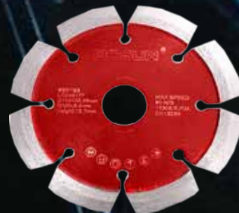
Diamant V-fug sprekkfres ø 115 mm .

Utvid sprekke før reparasjon, lag dryppspor oppunder terrasser.